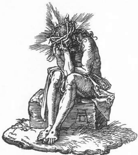
Albrecht Dürer, strona tytułowa Małej Pasji , drzeworyt, 1511, źródło: Wikimedia Commons , domena publiczna

Badacze przyjmują, że jednym ze źródeł popularności tego wizerunku była między innymi rycina Albrechta Dürera z okładki Małej Pasji (zbioru 37 rycin stworzonych na początku XVI wieku), która stanowiła źródło inspiracji, bądź wzór ikonograficzny dla wielu artystów.