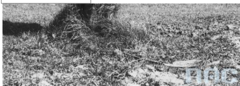
Narodowe Archiwum Cyfrowe, sygn. 1-U-4327 Nowica, przydrożna kapliczka, 1918, źródło: Narodowe Archiwum Cyfrowe

Ten utwór jest dostępny na licencji Creative Commons Uznanie autorstwa 3.0 Polska .